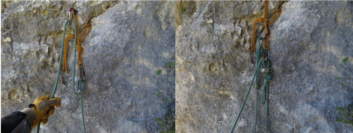
Zaviralno vrv zaradi zagotavljanja trenja speljemo skozi vponko v enem od klinov sidrišča. Reverso naj bo med privezovanjem drugega blokirana

Vrv lahko blokiramo tudi na sami napravi. Neobremenjeni konec vrvi v zanki prevlečemo skozi nosilno vponko v sidrišču in jo na drugi strani z varovalnim vozlom zavežemo okoli obremenjene vrvi.