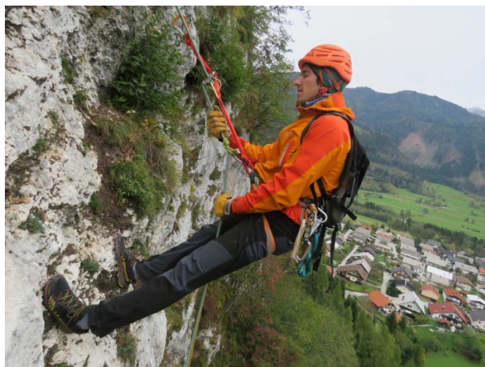
Ena roka potiska vozel samovarovanja navzdol. Z razširjenima nogama smo v steno uprti pravokotno.

Posebno bodimo pozorni pri metu vrvi na poraščenem terenu. Tudi tu je veliko možnosti, da se vrv ujame na veje in prepreči spust. V takem primeru vrv raje navijmo okoli telesa (ramabok) in jo ob spustu proti odvijajmo.