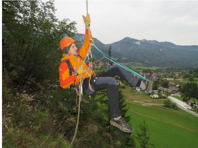
Pripravljen za dvig po vrvi