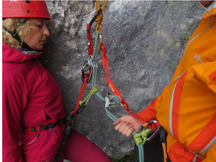
Naprava »čakajočega« je vedno tik pod sidriščem.

Med spustom prvega je vrv nenehno napeta, obremenjena in ni nevarnosti, da bi drugi samovoljno lahko začel s spustom.