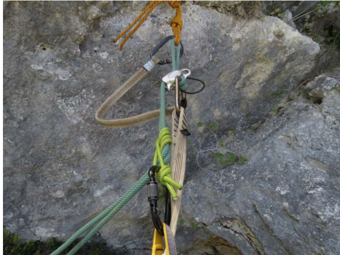
Pravilno nameščena vrv in samovarovanje

Če začetek spusta opravljamo v visečem položaju je preizkus otežen ali celo nemogoč.