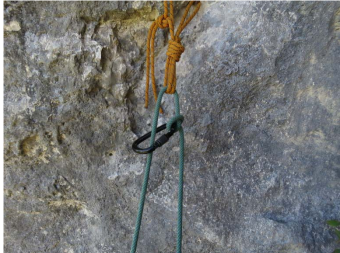
Na poškodovani vrvi naredimo bičev voz in z vponko objamemo »zdravo« vrv

Imamo poškodovano vrv. Kako opravimo spust v tem primeru? Ko je vrv prevlečena skozi uho sidriščne zanke na polovici vrvi, tik ob prehodu skozi zanko (na poškodovani polovici) naredimo bičev voz, vanj vpnemo vponko z matico in objemimo drugi, zdravi konec vrvi. Spust bomo opravili po zdravi, nepoškodovani polovici vrvi (spust po enojni vrvi), drugi, poškodovani konec je med spustom ohlapno pripet ob pas, da nam ga veter ne odnese z dosega rok. Ta konec bo kasneje služil za poteg vrvi iz stene. Pri takem spustu MORATA vrvi teči od sidrišča do roba stene vzporedno (skupaj), sicer vrvi ne moremo povleči za seboj.