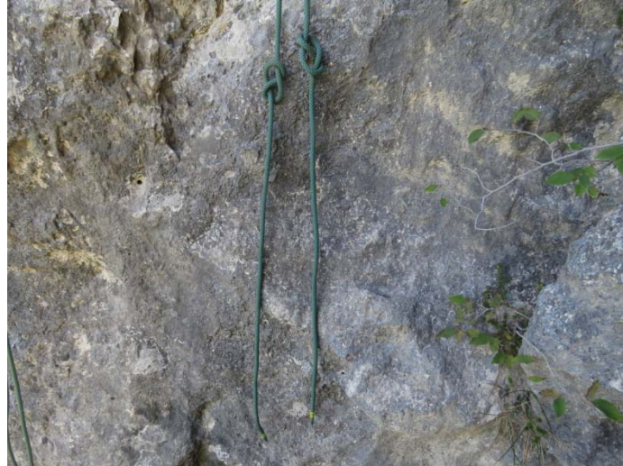
Kak meter pred koncem vrvi naredimo vozla

Ko je vrv približno na sredini, najprej na enem koncu vrvi in nato še na drugem, ki je bil do tedaj pripet na plezalni pas, približno en seženj od konca naredimo končni vozel (osmica).